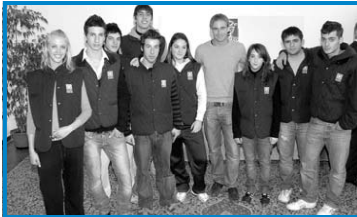
Filippo Volandri con alcuni studenti del Liceo scientifico sportivo di Firenze